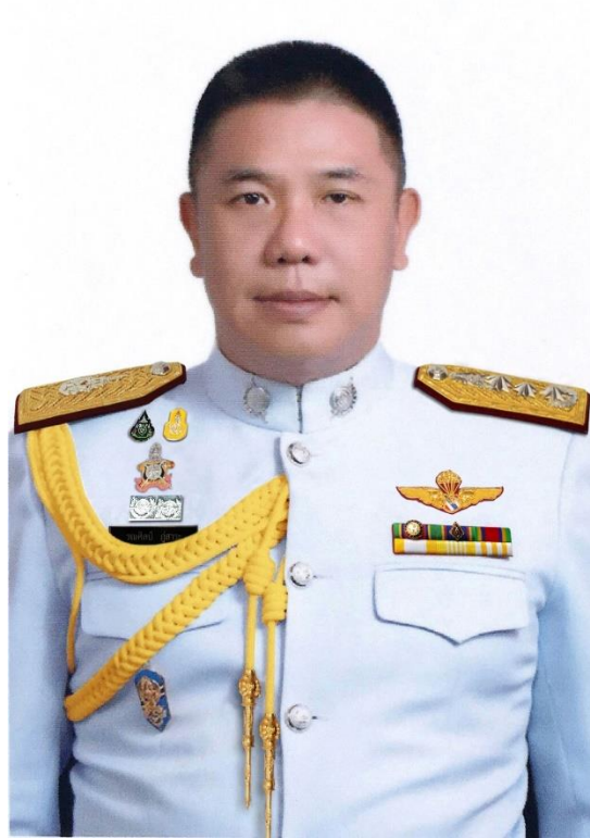
พลตำรวจโท รณศิลป์ ภูสาระ ผู้บัญชาการตำรวจภูธรภาค ๘